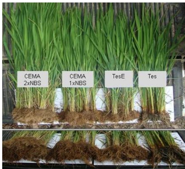
Figura 4. Comparação de maços de cinco plantas de cada tratamento, aos 93 dias de cultivo.

apresentando engrossamento característico de infestação por nematoides de galha (Figura 4); menor massa foliar; menor número de perfilhos.