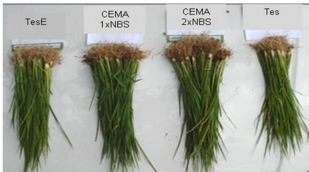
Figura 1: Comparação de maços de trinta plantas de cada tratamento, aos vinte sete dias de cultivo. Figure 1. Comparison of bundles of thirty plants of each treatment, the twenty-seven days of culture.

Mesmo com essa adversidade o cultivar InovCL conseguiu germinar e crescer, fato que se deve especialmente ao desenvolvimento radicular mais profundo que propiciou aproveitamento de água nas camadas mais baixas do solo (Figuras 1, 2, 3).