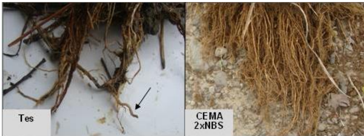
Figura 5: Sintomas de nematode de galha das raízes. Tes: raízes com sintomas de nematoides, engrossamento nas pontas, apresentando menor quantidade de radículas; CEMA 2xNBS: raízes saudáveis, com pontas bem afiladas e grande número de radículas.

Figure 5. Symptoms of nematode galls roots. Tes: roots with symptoms of nematodes, thickening at the ends, with fewer rootlets; CEMA 2xNBS: healthy roots with well tapered ends and many rootlets.